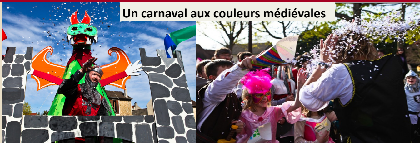
Un carnaval aux couleurs médiévales