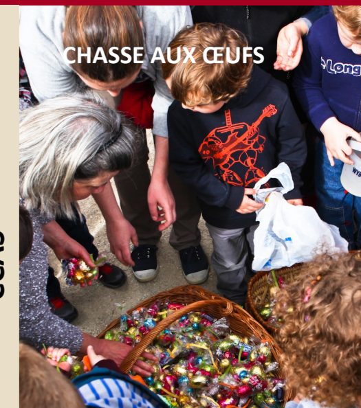
CHASSE AUX ŒUFS

Les cloches sont passées au square Michel Dardelet dimanche 6 avril : elles ont déposé œufs et lapins en chocolat pour le plaisir des petits et des grands.