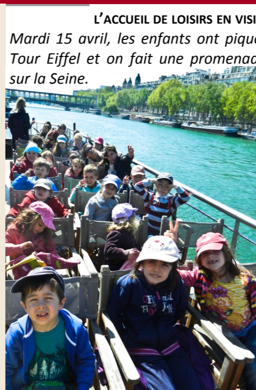
L'ACCUEIL DE LOISIRS EN VISITE A PARIS

Mardi 15 avril, les enfants ont pique-niqué au pied de la Tour Eiffel et on fait une promenade en bateau-mouche sur la Seine.